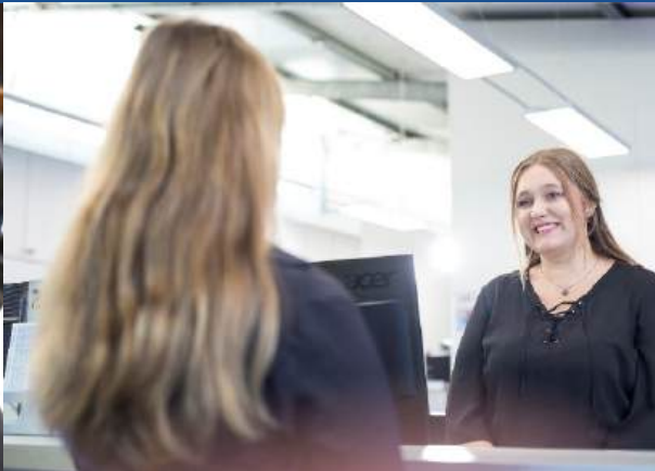
Kaufmann/-frau für Büromanagement