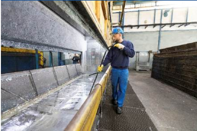
Verfahrensmechaniker/-in für Beschichtungstechnik, Schwerpunkt Feuerverzinken