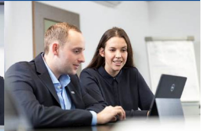
Wirtschaft - Industriekaufmann/-frau